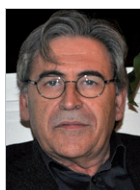
César Coll Catedrático de Psicología de la Educación. Universidad de Barcelona

Por todo ello, la FE de CCOO ha presentado en el Consejo Escolar del Estado un Informe alternativo, solicitado al Ministerio de Educación la retirada del anteproyecto de la LOMCE y la apertura de un auténtico proceso de reflexión, debate y negociación para intentar resolver los problemas de nuestro sistema educativo.