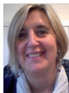
M a Luisa García Gurrutxaga Presidenta del Consejo Escolar de Euskadi

Quiero comenzar este artículo señalando la duda que suscita la pertinencia de una modificación sustancial del marco legal vigente. Toda reforma educativa debe ser fruto del consenso político y social y ese es el compromiso que debería asumirse en este momento de crisis estructural de la economía española y de su modelo productivo.