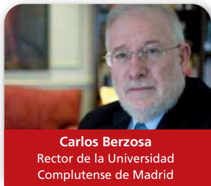
Carlos Berzosa Rector de la Universidad Complutense de Madrid

Que la apuesta por la calidad no sea un ejercicio de burocratizar la escuela a través de los protocolos y rutinas a seguir, al contrario, debe impulsarla a centrarse más en el alumno, a tener en cuenta sus diferencias y a canalizar todos los recursos para que logre el éxito, sin exclusiones y facilitando el acceso a todos. Para ello se requiere una financiación adecuada, de forma que el centro y el profesorado pueda disponer de los medios necesarios para propiciar una buena educación.