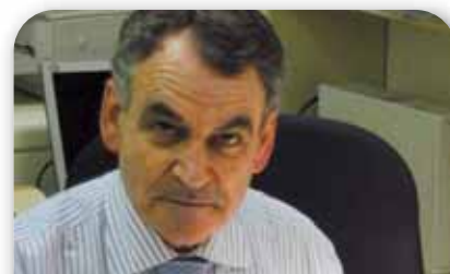
Adolfo Abejón Portavoz de Educación del Grupo Popular en el Senado

3 No encuentro aspectos en los que esté en desacuerdo con las medidas propuestas. No obstante, considero que podrían ser más ambiciosas en la etapa de la Educación Primaria, ampliando, por ejemplo, los programas de refuerzo de las competencias básicas al primer curso de la etapa.