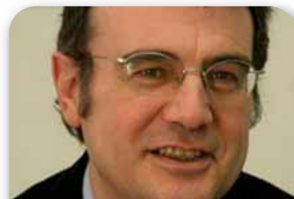
Francesc Colomé Secretario General de Políticas Educativas de Cataluña

Asimismo, el Ministerio no aclara si está dispuesto a impulsar una Ley Orgánica de Medidas Urgentes para la cohesión y la calidad del sistema educativo, que incluya todas las reformas necesarias para dar cumplimiento a los contenidos y objetivos que recoja el Pacto.