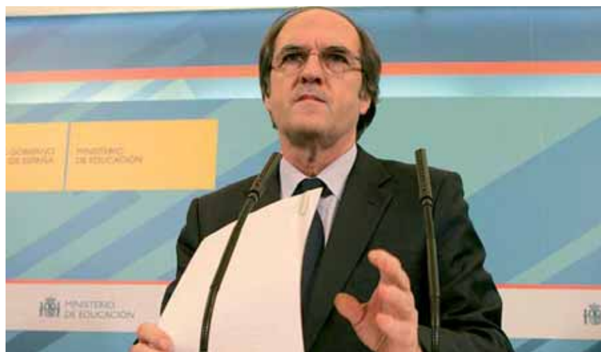
El ministro de Educación, Ángel Gabilondo, en una comparecencia ante la prensa en la sede del Ministerio.

Segundo, también ha evolucionado el Estado de las autonomías y las técnicas normativas. Ahora, el Ministerio de Educación como legislador básico tiene que regular los aspectos comunes que luego desarrollarán las comunidades autónomas. Y lo ha hecho tomando como referente el Código Técnico de la Edificación y de manera conforme al Derecho europeo.