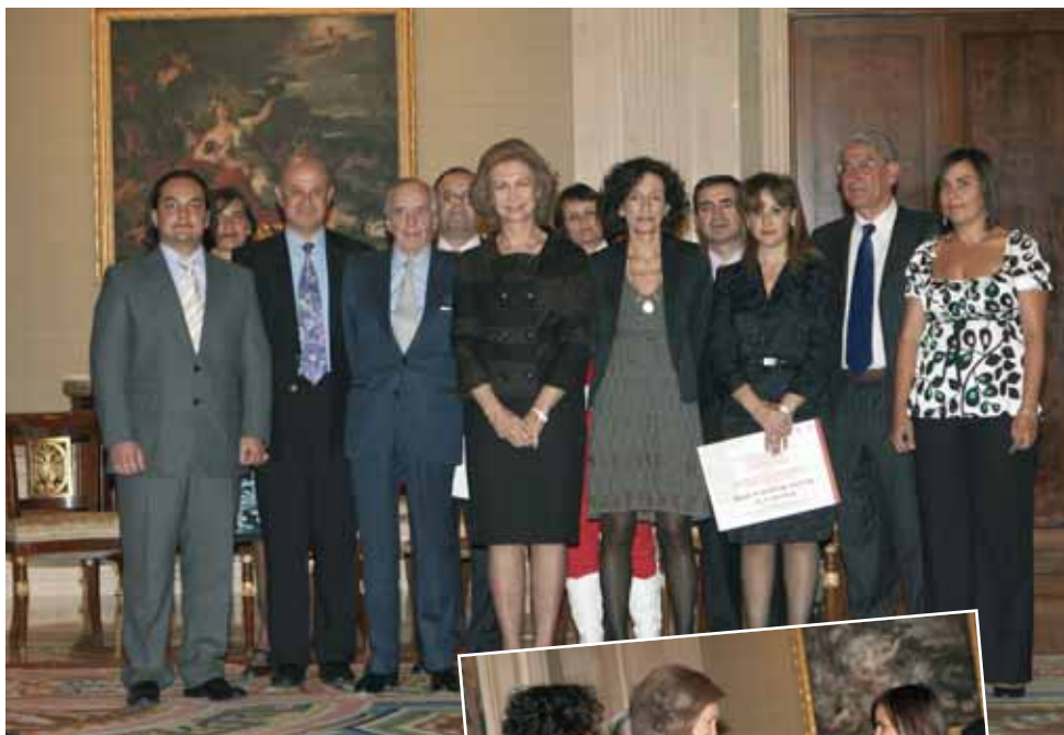
La reina Sofía y la ministra de Educación, Mercedes Cabrera, junto a los profesores galardonados con el Premio a la Acción Magistral 2008

Además, otros tres centros fueron merecedores de menciones especiales. La primera de ellas fue para el colegio público San Antonio de Portaceli de Sigüenza (Guadalajara) por un proyecto de prevención de la violencia de género realizado por cuatro profesores