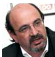
José Campos Trujillo Secretario General FE CCOO

DURANTE el mes de octubre hemos mantenido reuniones con el Gobierno en el marco del proceso de Diálogo Social, para tratar varios planes y programas de especial relevancia para la mejora de nuestro sistema educativo. Me refiero al Plan Educa3, actuación integral para generalización de la oferta educativa en el nivel de 0 a 3 años, el Plan de Mejora de la Formación Profesional, presentado en estos días a los agentes sociales con su calendario y plazos de ejecución, y el Programa Universidad-2015 y cómo no, los referidos al cierre del Estatuto Docente y el inicio de las negociaciones del Estatuto Universitario, previstos en este mes de noviembre.