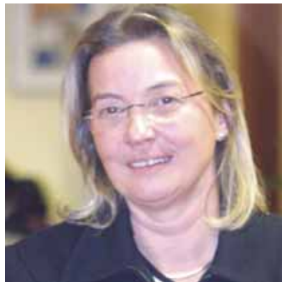
Eva Almunia, secretaria de Estado de Educación.