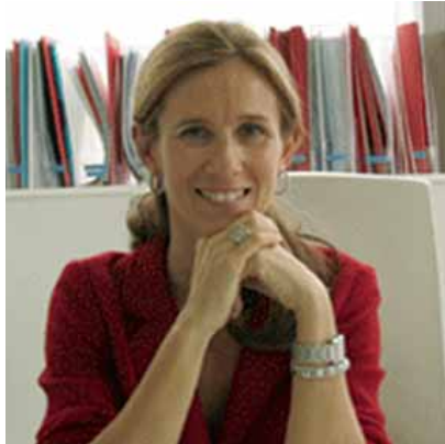
Cristina Garmendia, ministra de Ciencia e Innovación.

Este Ministerio de nueva creación se estructura, según se especifica en el citado real decreto, en dos órganos superiores: la Secretaría de Estado de