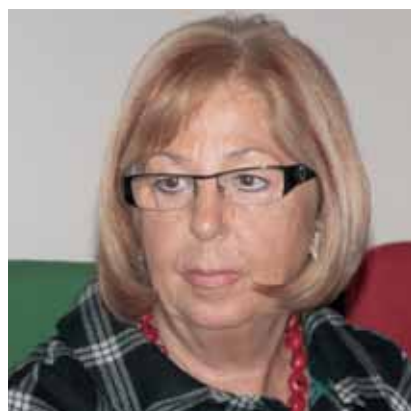
Adelaida de la Calle Rectora de la Universidad de Málaga

“Una universidad pública de calidad es la única capaz de garantizar la verdadera igualdad”