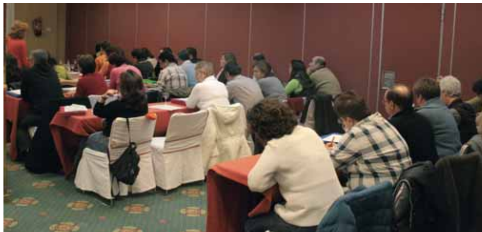
Participantes en las jornadas de formación del PSEC

Se completó la primera jornada de debate con la ponencia a cargo del