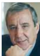
Ignacio Calderón Director General de la Fundación de Ayuda contra la Drogadicción (FAD)