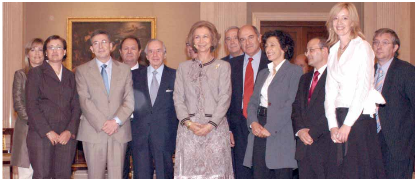
La reina Doña Sofía, acompañada por la ministra de Educación, Mercedes Cabrera, por el filósofo Jose Antonio Marina y por profesores del C. P. Miralvalle de Plasencia (Cáceres) galardonado con el Premio Acción Magistral 2006, otorgado por la FAD

Y los responsables directos, aquellos que pueden hacerlo posible, son los docentes a los que sólo me queda animarles, tenderles una mano amiga desde la FAD y emplazarles a que participen en la convocatoria del Premio a la Acción Magistral 2007, que se hará pública dentro de unas semanas.