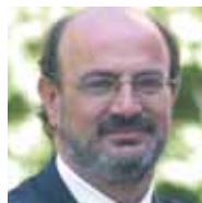
José Campos Trujillo Secretario General FE CC.OO.

DESDE hace tiempo venimos apostando por un Pacto de Estado por la Educación con el objetivo de dotar de estabilidad a nuestro sistema educativo más allá de cualquier legislatura marcada por un determinado color político.