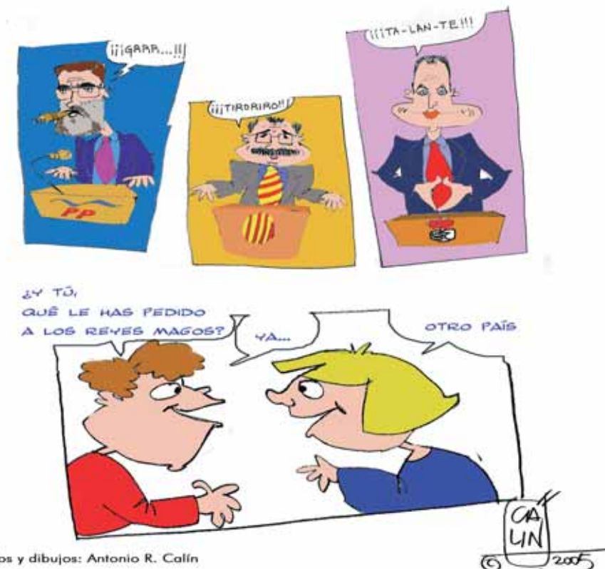
Textos y dibujos: Antonio R. Calín

Según un estudio sobre videojuegos y menores, presentado por el Defensor del Menor de la Comunidad de Madrid y la ONG Protégeles, uno de cada tres niños y adolescentes de 10 a 17 años usa videojuegos para mayores de edad, el 57% de ellos reconoce que mata o tortura personas en esos juegos y el 35% dice que dedica más de una hora diaria entre semana a esta diversión.