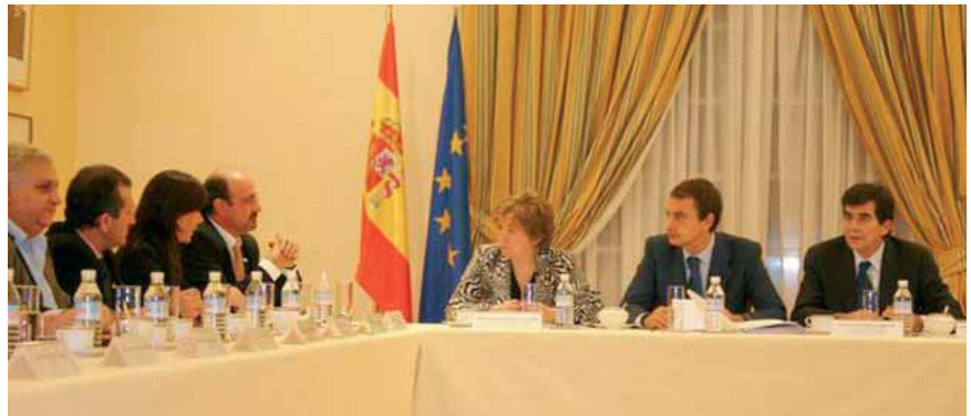
Los delegados de CC.OO. conversan con Rodríguez Zapatero, en la reunión que mantuvieron en la Moncloa.

económicos necesarios y suficientes para hacer efectiva la aplicación y desarrollo de la reforma e incrementar el gasto educativo hasta alcanzar el 6% del PIB, en el manifiesto se piden medidas que aseguren en toda la red sostenida con fondos públicos el cumplimiento del principio de atención a la diversidad en condiciones de equidad. Para conseguir este objetivo, se propone reforzar la acción tutorial, reducir las ratios, determinar las zonas de atención preferente y vertebrar un plan que aborde los problemas de convivencia en los centros, entre otras medidas.