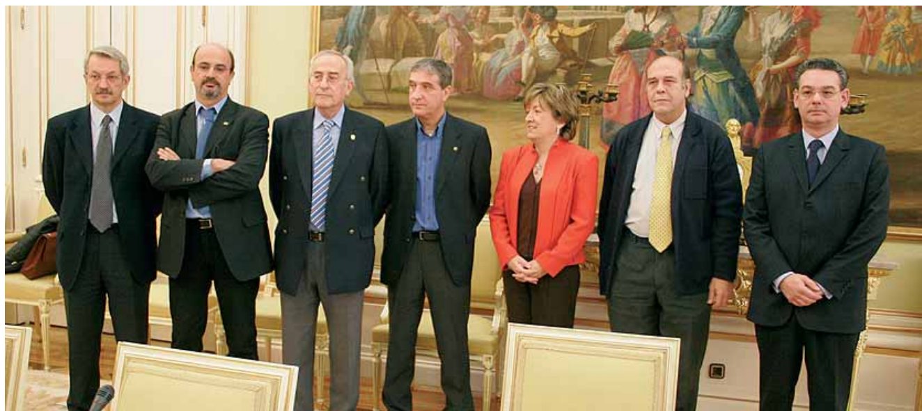
La ministra de Educación, María Jesús San Segundo, junto a los cuatro representantes de los sindicatos firmantes del Acuerdo y dos altos cargos del MEC.