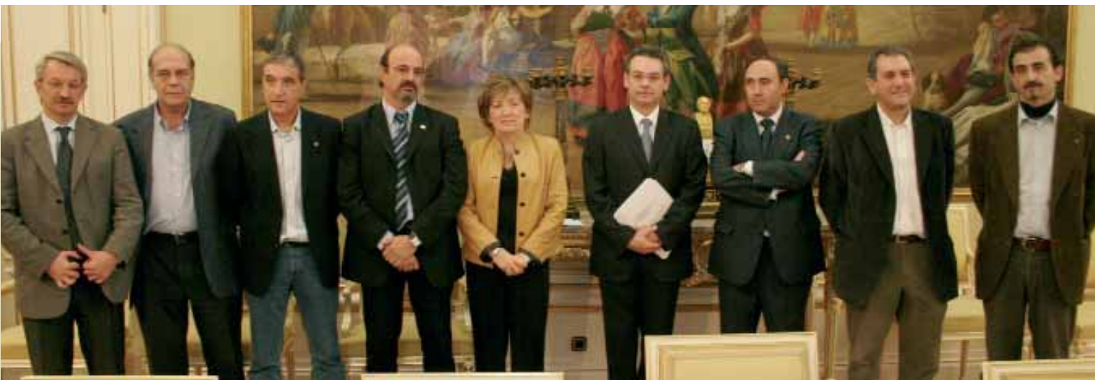
Los máximos responsables del Ministerio de Educación posan junto a los dirigentes de los seis sindicatos firmantes del Acuerdo laboral

Ahora tendrán que explicarse aquellos sindicatos que han propuesto promesas que no coincidían con lo que reivindicaban en las Mesas de Negociación. A los que siempre hemos dicho lo mismo en todos los foros nos podrán decir que no les gusta lo que hemos pactado, pero nunca nos podrán decir que les hemos engañado. Y es que la solución acordada al sistema de acceso es la única posible y la mejor para el colectivo de interinos. Lo demás es humo y demagogia. Es impresentable llevar a un colectivo a huelgas y movilizaciones por una reivindicación el mismo día en que se está firmando todo lo contrario.