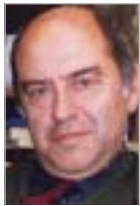
José Antonio Marina Profesor y filósofo