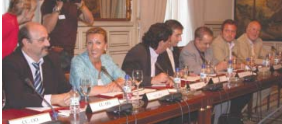
Los representantes sindicales en el acto de la firma del Acuerdo en el MAP

En las actuaciones de protección y promoción social, la partida mayor, el 31,8%, con 79.221 millones de euros, es para el abono de pensiones. Otras prestaciones económicas, como los créditos destinados a la incapacidad temporal, la maternidad y la protección familiar, disponen de 10.656 millones. Al desempleo se destinan 12.688 millones, mientras que al fomento del empleo van 6.233 millones. El Gobierno prevé un ligero descenso del paro durante el próximo año, se calcula que crecerá en un 2%, con la creación de 331.900 puestos de trabajo.