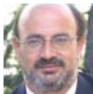
José Campos Trujillo Secretario General FE CC.OO.

EL NUEVO curso ya está en marcha. Avistamos nuevos horizontes de construcción y avance social en “la nueva Europa”. Su Constitución se abrirá paso este año con el posible refrendo de las nacionalidades comunitarias. En España será sobre marzo y CC.OO., al igual que la Confederación Europea de Sindicatos (CES), ya ha expresado su conformidad con la Carta Magna como “arranque aceptable hacia una deseable Europa social”.