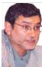
Fernando Lezcano Secretario General FE CC.OO.

La convocatoria de las elecciones generales para el 14 de marzo constituye un buen pretexto para reflexionar sobre los problemas de nuestro sistema educativo, valorar la política seguida por el Gobierno del PP y prestar atención a las ofertas electorales de los diferentes partidos contrastándolas con los planteamientos de CC.OO. para el mundo del trabajo en general y la educación en particular