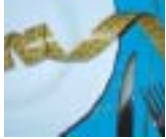
Imagen corporal, cultura y género

En los últimos cincuenta años venimos asistiendo a un incremento, sobre todo de mujeres, aunque también de hombres, que manifiestan insatisfacción con su imagen corporal. También en este período de tiempo, los trastornos del comportamiento alimentario (TCA), de los que la anorexia y la bulimia son los más conocidos, han aumentado de forma importante