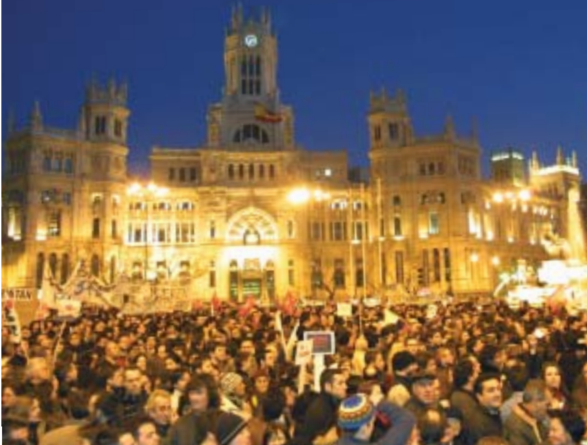
Vista panorámica de la manifestación del día 15 de febrero en la plaza de La Cibeles de Madrid