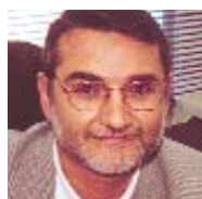
Fernando Lezcano Secretario general FECCOO

LAS ELECCIONES sindicales que se están celebrando en la enseñanza privada y en la pública, en la universidad y en los niveles anteriores a ella, y en el personal laboral y funcionario, se inscriben dentro de un proceso más amplio que abarca a todos los sectores de la producción y de los servicios del conjunto del Estado.