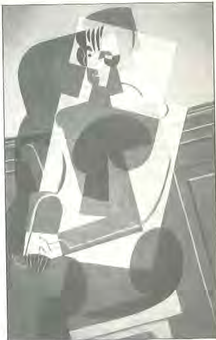
Retrato de Joseffe 1916 Juan Gris.

falta y no ideología disfuncional. Para ello, el sistema utilizado es recortar y aislar aquellas zonas «periféricas» del conocimiento.