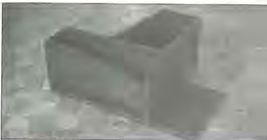
«Los amigos», Pello Jraza.

e) Por su extensión y estar contemplado en un Real Decreto, tratamos el tercer ciclo en el Anexo 1.