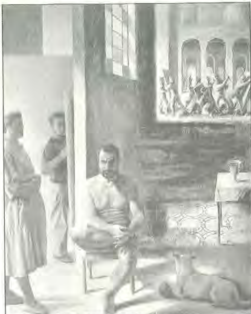
«Sacra conversación». Guillermo Pérez Villalta. 1986.

2.º, que el MEC tiene un especial cuidado en financiar las actividades de los consejos sociales, a fin de que no sean gravosos para sus respectivas universidades. Ello le lleva a no escatimar en sueldos (como los que se ponen los secretarios de dichos consejos, en general no justificados por su dedicación al cargo), ni en financiación de mobiliario y equipo; 3.º, desaparecen los fondos que a través de la CAICYT dedicaba la universidad a la investigación. A partir de ahora y por obra y gracia del Plan (?) Nacional de Ciencia, la universidad queda integrada en el Programa de Promoción General del Conocimiento, administrándose sus fondos a través del Fondo Nacional de Investigación Científica. La investigación universitaria y la aplicación del artículo 11 de la LRU como generadora de ingresos para la universidad vía contratos, sufren así un nuevo cambio de rumbo. De hecho, hasta el momento, las relaciones entre las uni-