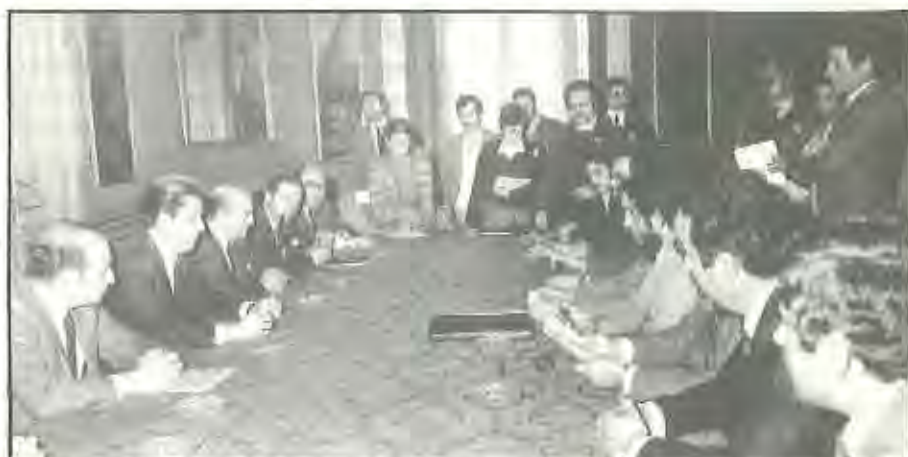
Monumento de la firma entre el Ministro de Educación y Ciencia, representantes de la J.C. de retribución y CC.OO., ANPE, FESPE y UCSTE.

La lucha de los funcionarios docentes para lograr la equiparación con los no docentes ha sido larga. Esta reivindicación, que ha ocupado siempre un lugar relevante en las plataformas reivindicativas de los Sindicatos, está en vías de consecución tras la aprobación del Decreto de Retribuciones Complementarias y la firma del Acuerdo del 9 de febrero, entre los Ministerios de Educación y Hacienda, por una parte, y ANPE, FESPE, UCSTE y CC.OO., por otra. El proceso de negociación también ha sido largo, pero ha merecido la pena.