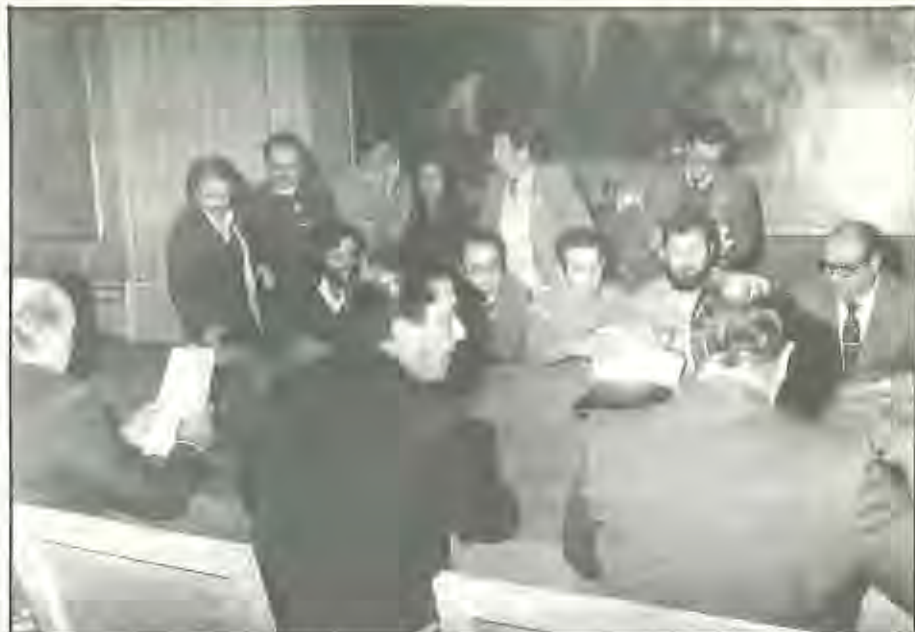
Cumplir los acuerdos es fundamental para dar credibilidad a la negociación y consolidar a los Sindicatos.