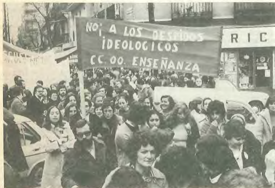
Los idearios de centros son una agresión clara a los principios democráticos en los que se debe inspirar la vida escolar

Los profesores de Centros públicos docentes deberían tener los siguientes deberes de carácter esencial: