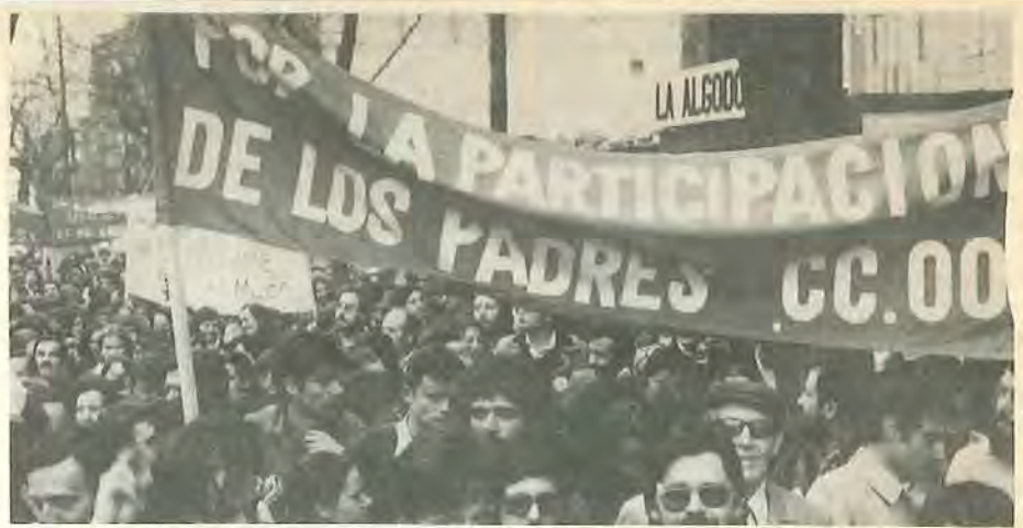
No puede haber gestión democrática de la escuela sin la participación activa de los padres

miento de los títulos que tengan validez en todo el territorio español.