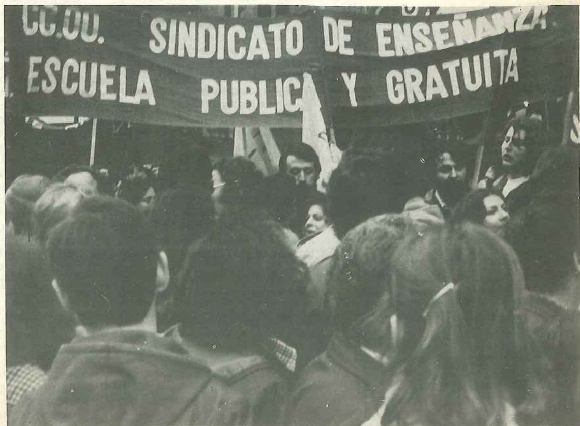
Es hora ya de caminar de forma decidida hacia una verdadera escuela pública. (Manifestación del 15 de abril)