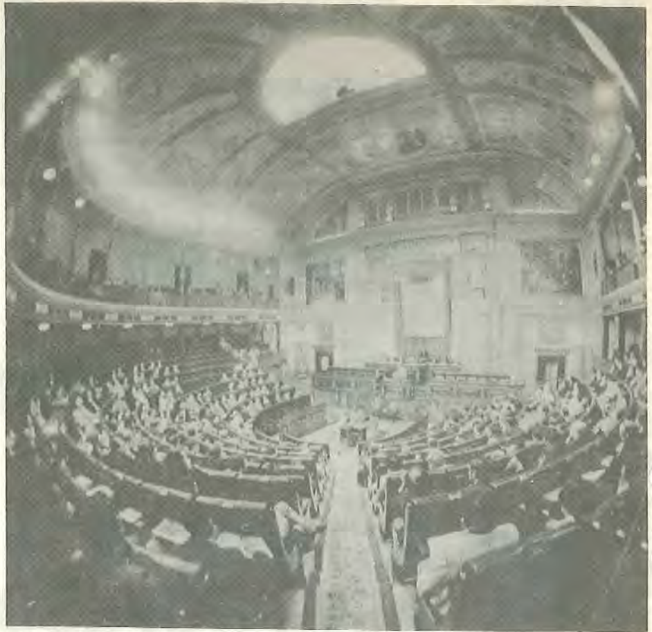
La democratización de la enseñanza es una de las necesidades más urgentes del país

Las movilizaciones habidas recientemente en el sector, especialmente las de EGB estatal, han hecho que el Ministerio se comprometiese (Acta de reunión del 4 de mayo entre el MEC y la negociadora de los maestros), a realizar consultas previas sobre el estatuto del profesorado antes de remitir el proyecto a las Cortes. La fecha tope que el MEC ha fijado para mandar nuestras opiniones y criterios es la del 22 de junio. Esta forma de proceder del MEC, tanto con un