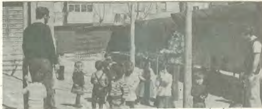
La educación debe desarrollar entre los niños un espíritu crítico y democrático

Las condiciones generales para ingreso en los Cuerpos docentes deberían ser: